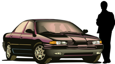
LES GROS ROULEURS